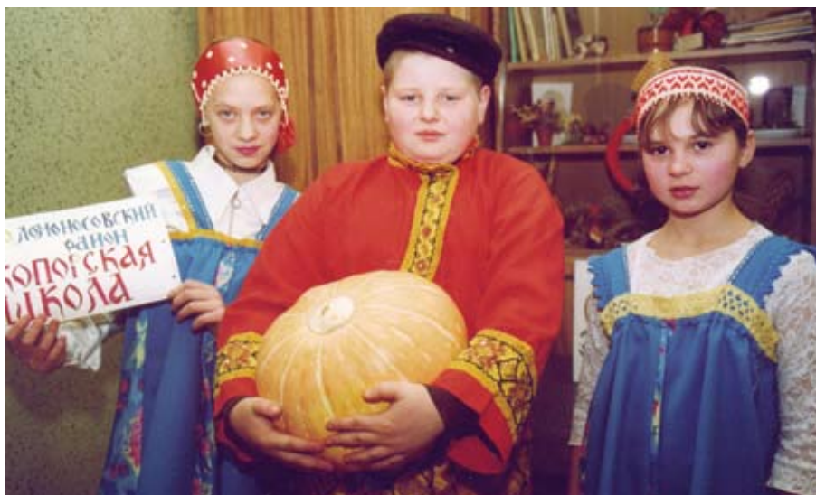
Stolta ungar i S:t Peterburg visar upp sin skörd