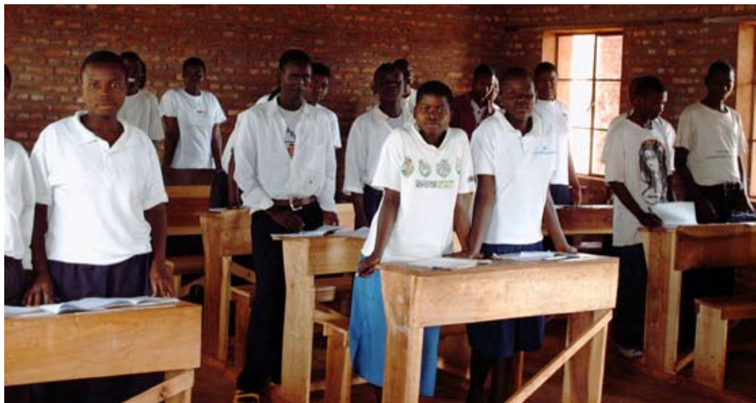
Ungdomar i Kväkarnas fredsskola 2006 kan nu fortsätta på det nya gymnasiet

Viktiga delmål är: att öka medvetenheten om HIV/AIDS och genusfrågor bland lokalbefolkningen; uppmuntra till och öka odling av grönsaker och ris och därigenom förbättra lönsamheten inom jordbruksområdet; att arbeta med återplantering av skog och motverka pågående miljöförstöring; samt förbättra den socioekonomiska situationen vid återflyttning och integrering av internflyktingar inom projektets verksamhetsområde. □