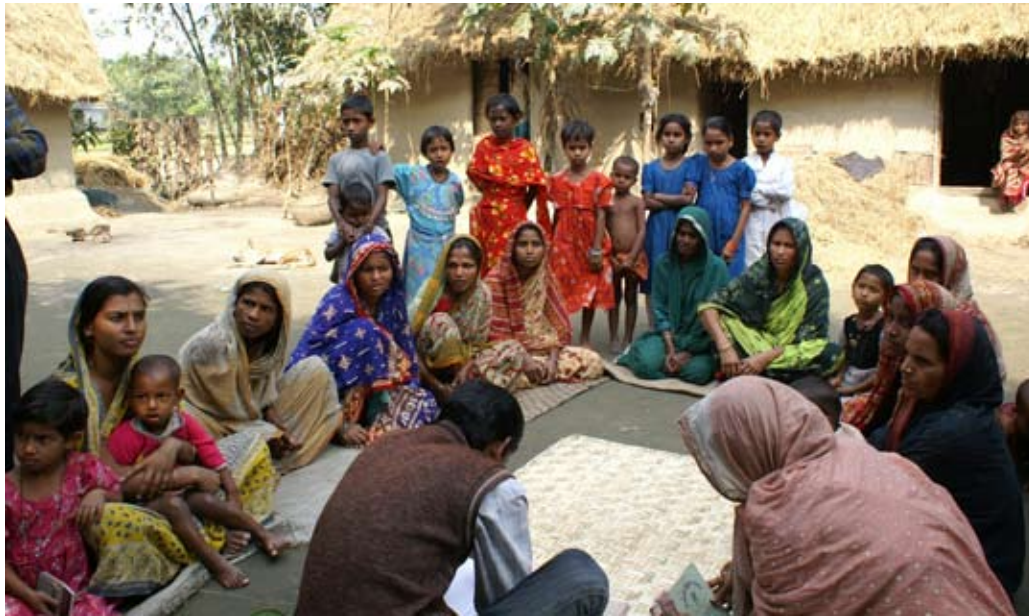
Grupp i Purbadhala i Bangladesh som arbetar med Mikrolån

Projektet har i sin helhet definierats utifrån behoven i det lokala samhället. Projektet syftar till att stimulera och utveckla det lokala samhällets resurser. Projektet vänder sig till de fattigaste kvinnorna utan jord, till barn, ungdomar och handikappade genom följande åtgärder.