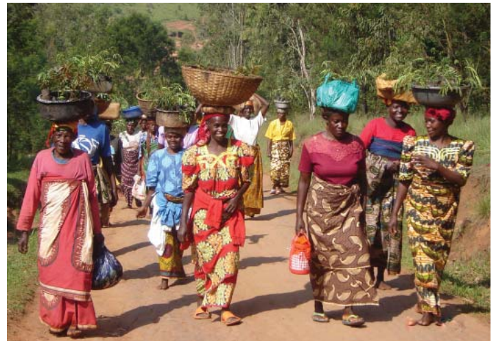
På Träddagen går alla ut för att plantera nya träd