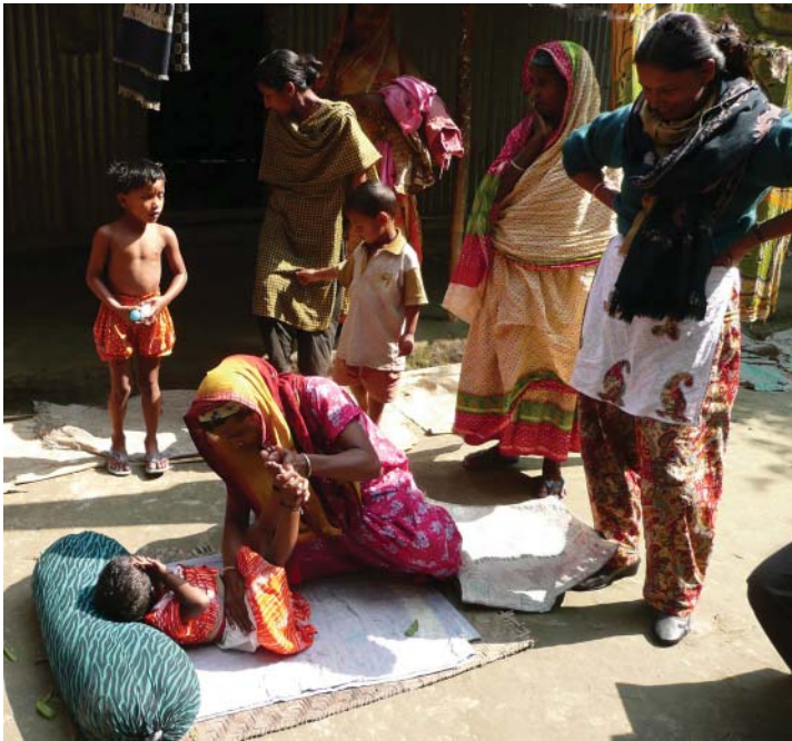
Mor får öva sjukgymnastik med handikappat barn. Sjukgymnasten t h övervakar. Byn deltar glatt!