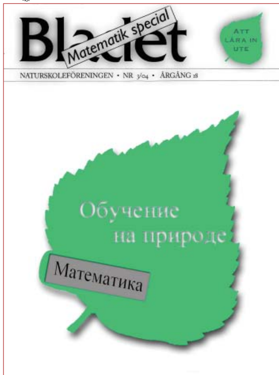
Mattebok för undervisning i det fria