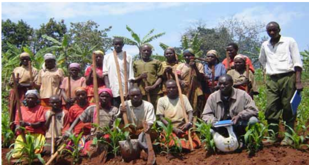
Deltagare i kooperativ i Burundi samlade under en paus i arbetet

Under decenniernas kriser mellan hutu och tutsi skövades värdefull jordbruksmark och trädbestånd. Målgruppen i insatsområdet är omkring 1 800 fattiga och utsatta personer, änkor, föräldralösa och familjer med en inkomst under 120 USD per år, som får lära sig att återställa marken och där odla sina grödor. Vår insats sker med Sidastöd och syftar till att via kooperativa modelljordbruk utveckla det lokala jordbruket och öka befolkningens självförsörjning. Vi samarbetar sedan 1994 med utvecklingskontoret vid den evangeliska kväarkyrkan i Burundi. Under 2008 bidrog vi med 220 400 kr enl. plan och 37 900 kr i extra bidrag.