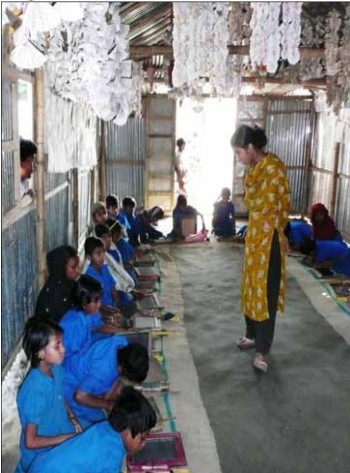
Skola i Purbadhala i Bangladesh i fullt arbete

kvinnor och män genom olika åtgärder. Våra kommittémedlemmar Sue och Tofte Frykman besökte projektet i Purbadhala och Netrakona i början av 2008 för att se verksamheten och diskutera dess framtid. Vi har under 2008 bidragit med 242 700 kr enligt projektplan och ytterligare 64 500 kr till att modernisera SUS administration och utrustning till hälsocentret i Netrakona.