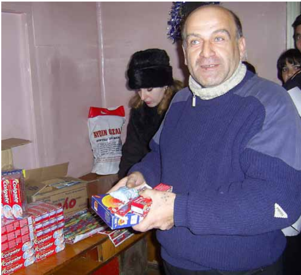
Utdelning av mat och förnödenheter i Friends House, Georgien