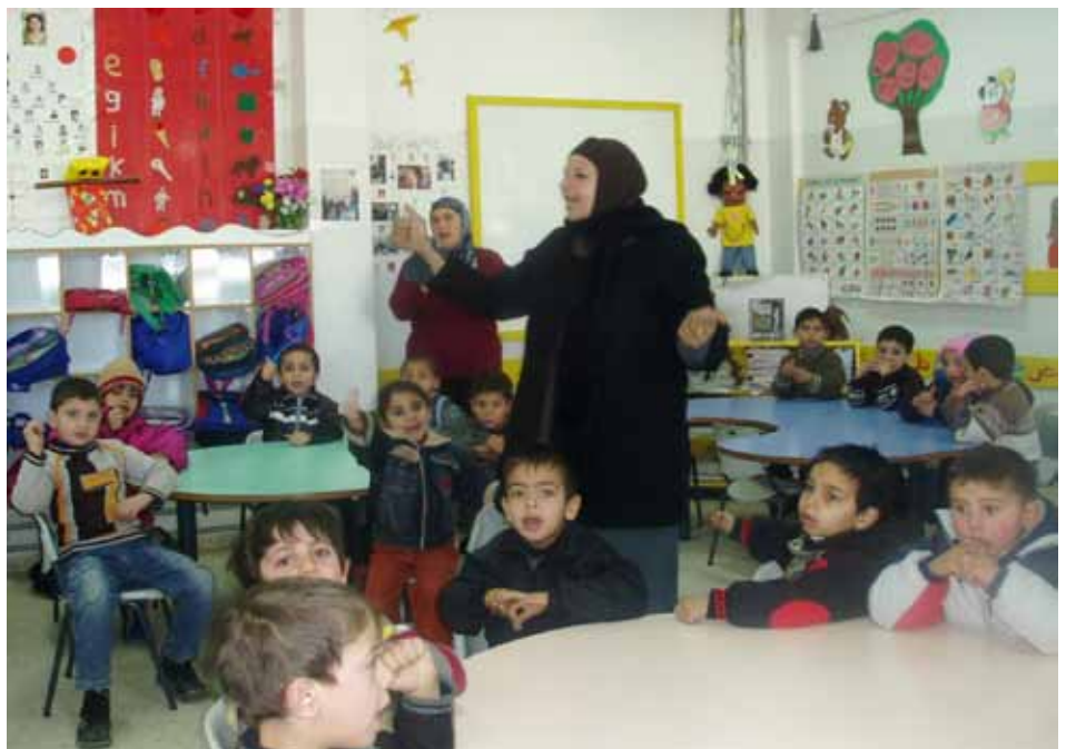
Barn i förskolan i Am'ari Camp i Ramallah

I Gaza stödjer Norges Kvekerhjälp sedan 15 år med stöd från Norges UD eller Norad 13 förskolor med c:a 1 700 barn 5-6 år. Efter kriget i Gaza har skolorna nu åter öppnat och behovet av hjälp till återuppbyggnad