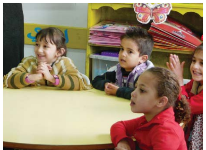
Barn i Am'ari Play Centre

Vi har ökat vår hjälpsats i Mellanöstern, där Norges Kvekerhjälp är verksam med stöd till 13 förskolor i Gaza. Efter kriget startade Kväkarhjälpens samarbete med Norge och insamlar öronmärkta medel för stöd till verksamheten. Framförallt behövdes bidrag till traumahealing bland barn och föräldrar. Tack för ditt bidrag – för ytterligare stöd märk talongen Gaza.