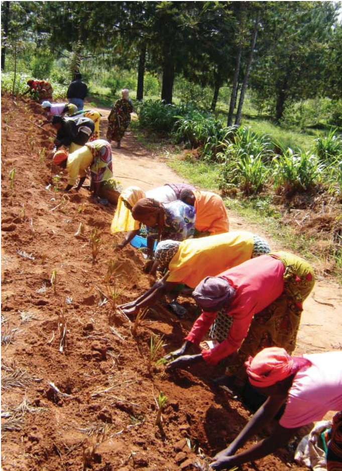
Samarbete på plantskola i Burundi

Det framgångsrika ”Uppbyggnadsarbetet för lokal matproduktion” fortsätter under åren 2009-2011, dock med en av Forum Syd hårt bantad budget.