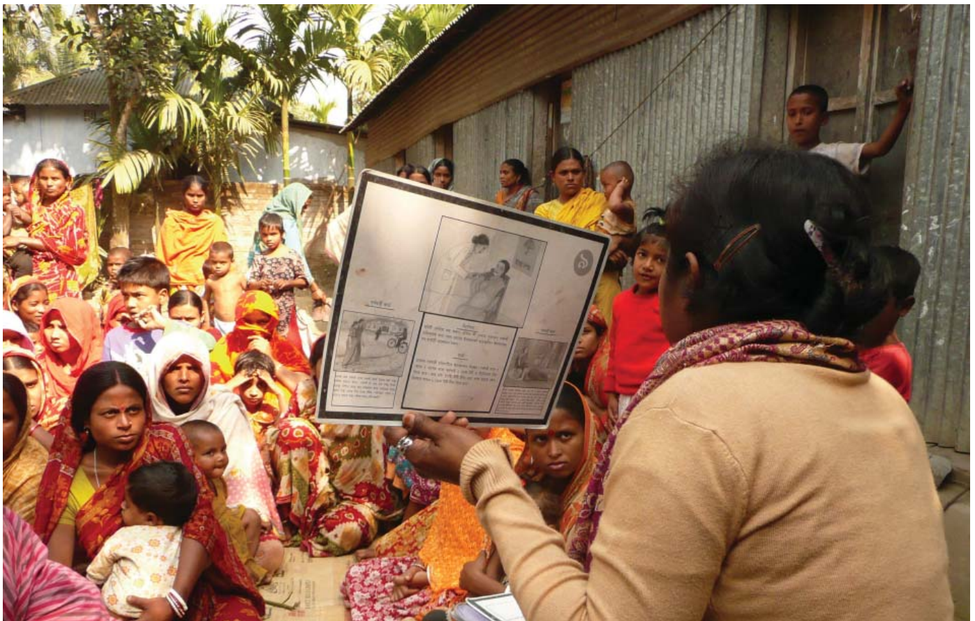
Föräldrar med barn och släktingar får lära sig mer om hälsofrågor av SUS personal