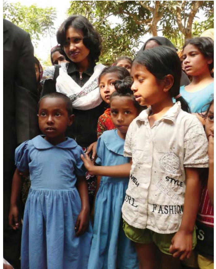
Barn från slummen i Mymensingh deltar

För 26 år sedan insåg en lärarinna i Bangladesh att