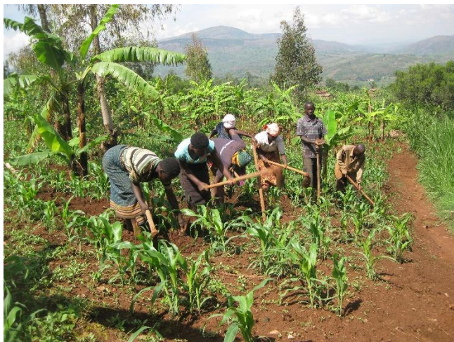
Arbete tillsammans ger bättre skördar

Arbetet med att förbättra odlingstekniker och kvalitén på fröer, liksom arbetet med att förhindra jorderosion genom plantering av skog fortsätter oförtrutet i olika distrikt i Gitega-området. Många center för detta arbete har nu blivit helt självförsörjande och nya center har kunnat öppnas. Intresset att delta och lära sig mer är stort och under 2018 nådde man 130 nya hushåll direkt och många fler deltog i studiebesök och i olika typer av samarbete. Skördarna av olika typer av bönor och majs var stora under året och man kunde sälja delar av skörden. Potatis,