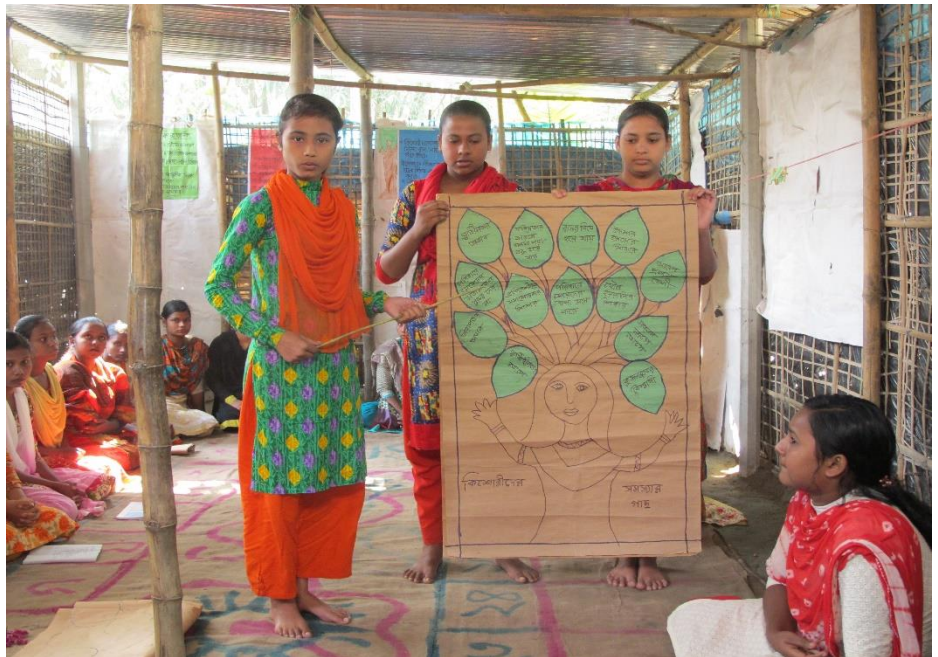
Ungdomsgrupp visar stolt upp vad man lärt sig och åstadkommit tillsammans.

Vi kan konstatera att Kväkarhjälpen har mycket låga administrativa kostnader. Vår insamling granskas av auktoriserad revisor och den godkända årsredovisningen utgör en del av Vännernas samfunds officiella redovisning. Kväkarhjälpen är en del av det svenska samfundet, men dess ekonomi är helt fristående från samfundets ekonomi i övrigt.