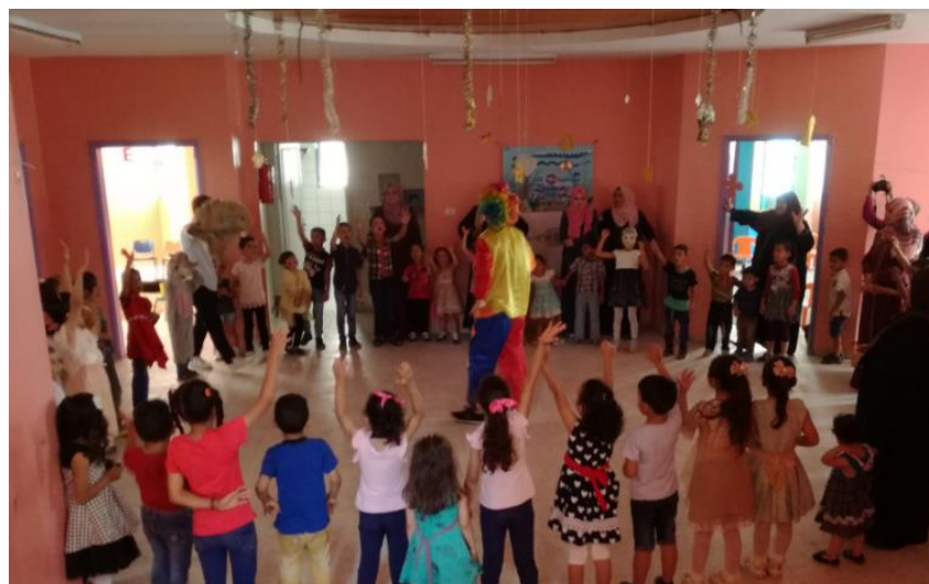
PECEP anordnade öppen daglägervecka under sommaren för barnen vid alla 13 förskolorna. Musik, konst, storytelling, dans och lekar stod på programmet.

Early Childhood Education Program) i 8 av Gazas flyktingläger. Omkring 1300 5-åringar ges varje vardagsförmiddag tillfälle till lek i en trygg miljö. De flesta barn i Gaza bär på trauma, så samarbetet med Gaza Community Mental Health Programme är viktigt. Psykologer från organisationen stöttar barnen och deras familjer. I varje förskola finns ett terapirum och barnen får möjlighet att bearbeta sina upplevelser genom drama och andra uttrycksätt.