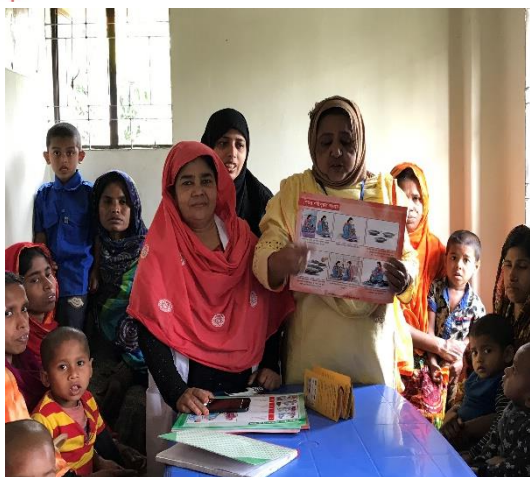
En lokal hälsoinstruktör undervisar kvinnor i en community clinic i byn Parail.

Två representanter från Kväkarhjälpkommittén besökte, tillsammans med handläggare från SMR, SUS verksamhet i början av mars 2019. I kommande nyhetsbrev får vi ta del av information om nya aktiviteter i byarna och om utökat samarbete med lokala myndigheter. Stärkta kontakter med myndigheter ökar möjligheterna att utkräva ansvar för till exempel undervisning och hälso- och sjukvård.