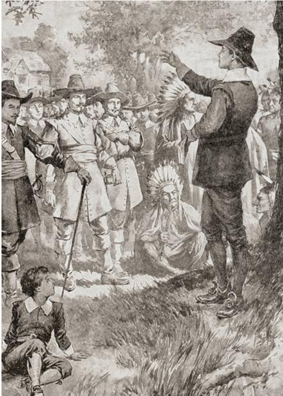
George Fox predikar för en grupp människor i USA 1671

Otvivelaktigt var hans [George Fox] ständiga studium av Nya testamentet det som framför allt ledde hans tankar i motsättning mot krig: Första gången detta kom till uttryck var i det berömda svar som Fox gav i Derbys fängelse, då man föreslog honom att bli befälhavare för en trupp i republikanernas armé. "Jag sade", berättar han, "att jag levde i kraft av det liv, som tar bort orsaken till alla krig. Jag hade kommit in i det fredsförbund som fanns före krig och strider" ... Det "fredsförbund", som han ingått i var nästan säkert i hans tanke andens liv... Han var foglig och varsam gentemot dem som tillhörde här eller flotta och likväl önskade bli "ljusets barn" och hans synes ha känt sig förvissade om att deras inre ledning till slut skulle föra dem till det "fredsförbund" som han hade funnit på sin väg... Kväkarna på Fox tid gjorde oerhört litet för att förklara och utveckla sin ställning i denna sak. Själv använder han ofta uttrycket: "Våra vapen äro andlig, icke köttsliga", vilket jag tror kan tagas som kärnan i kväkarnas hållning under den första generationen.