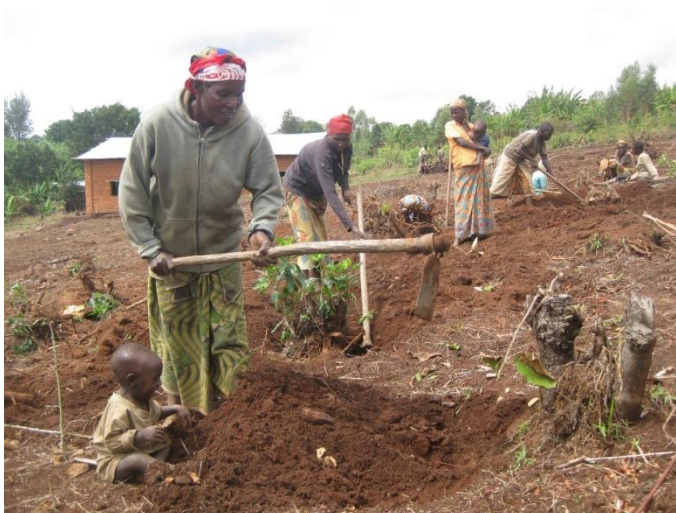
Bearbetning med hackor, alla hjälper till.

Gemensamma utbildningsdagar, samarbete och kontakter mellan de olika kooperativen leder till stabilitet och fred i området. Man hoppas också kunna bilda ett mer formellt och fastare nätverk mellan kooperativen. Allt detta innebär förhoppningsvis att ev. orolighet i samband med stundande val under 2020 inte ska få fäste i området.