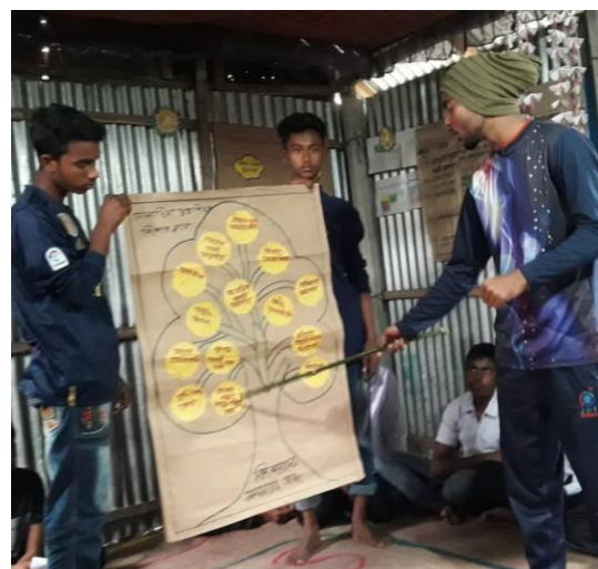
Pojkarna pratar igenom sitt "problemträd"

Vid uppföljningsbesök i mars 2019 träffade vi de äldre kvinnorna och de gråskäggiga krigsveteranerna i seniorklubbarna. De berättade stolt om hur de nu har fått en viktig roll som byns beskyddare och stöd åt ungdomsgrupperna. Bland annat är de aktiva när det gäller att stoppa barnnäktenskap. Äntligen känner de sig behövda och i ett sammanhang.