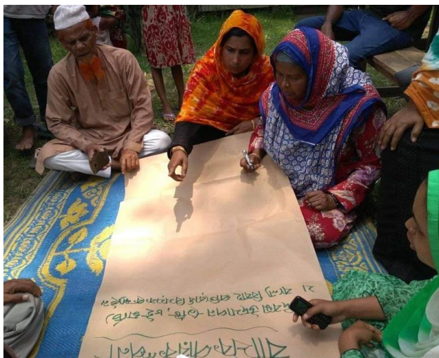
Seniorklubben arbetar med sin årsplan

SUS har under året arbetat i 17 byar i Kendua och 18 byar i Mymensingh enligt den integrerade modellen, där många olika sinsemellan stödjande grupper bildas. Konceptet fortsätter att utvecklas: Nu har pilotgrupper för seniorer respektive pojkar startats. Planen är att införa sådana på bred front i projektperioden som startar 2021.