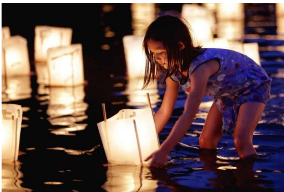
Att tända lyktor på årsdagen av bombningarna är en nu 74 år gammal tradition