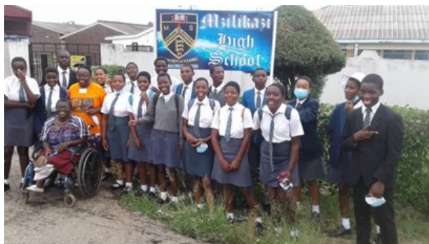
Elever och ledare vid Mzilikazi High School Peace Club, Bulawayo

Detta arbete för fred är mycket uppskattat i ett land som Zimbabwe, med sin långa historia av våld.