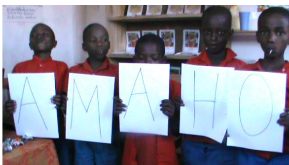
"Fred" på det lokala språket Kirundi