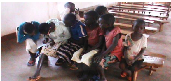
En av flickgrupperna

Det nystartade fredsbiblioteket i Burundi är förlagt till kväkarkyrkan i staden Gitega och har blivit mycket populärt. Böckerna efterfrågas dagligen, både av skolelever och äldre.