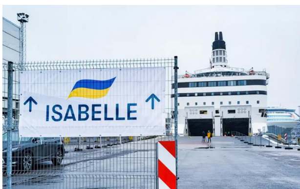
Flyktingboendet på en båt i Tallinn

Det är snarare så att det på ett kraftfullt och symboliskt sätt gjort mig medveten om den långa, spända väntan miljoner människor står inför, medan de hoppas och ber för att kriget i deras hemland ska ta slut.”