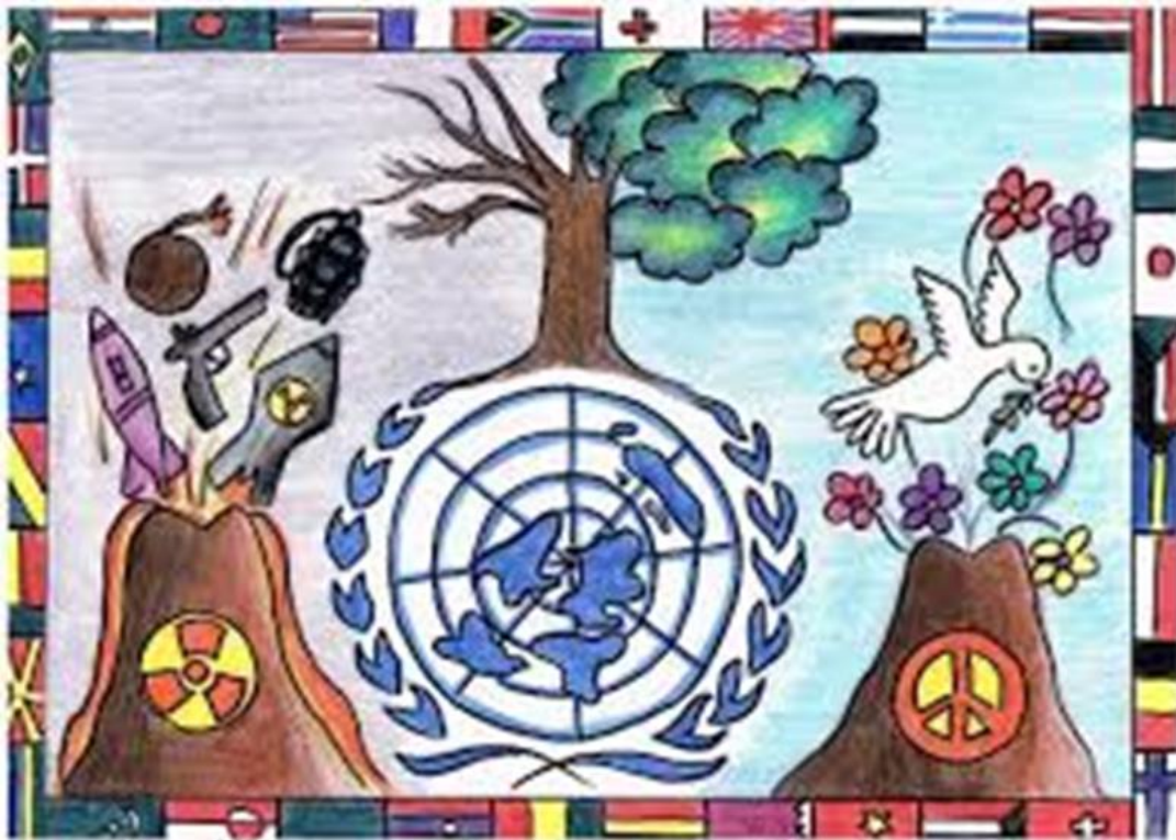
Say no to nuclear arms and welcome the dove, målad av Nehar R, 13 år, i Dubai för FN-projektet "konst för fred"

Vi fortsätter att medverka till institutioner för fred. En rättsordning på fredsgrund kräver bindande ramverk i internationell lag och en återupprättande rättvisa, och samtidigt en global kraftsamling för våldsprevention i lokalsamhällena. Brister i alla dessa avseenden har medverkat till orätten i Ukraina. Förstärkta institutioner måste till för att vinna fred.