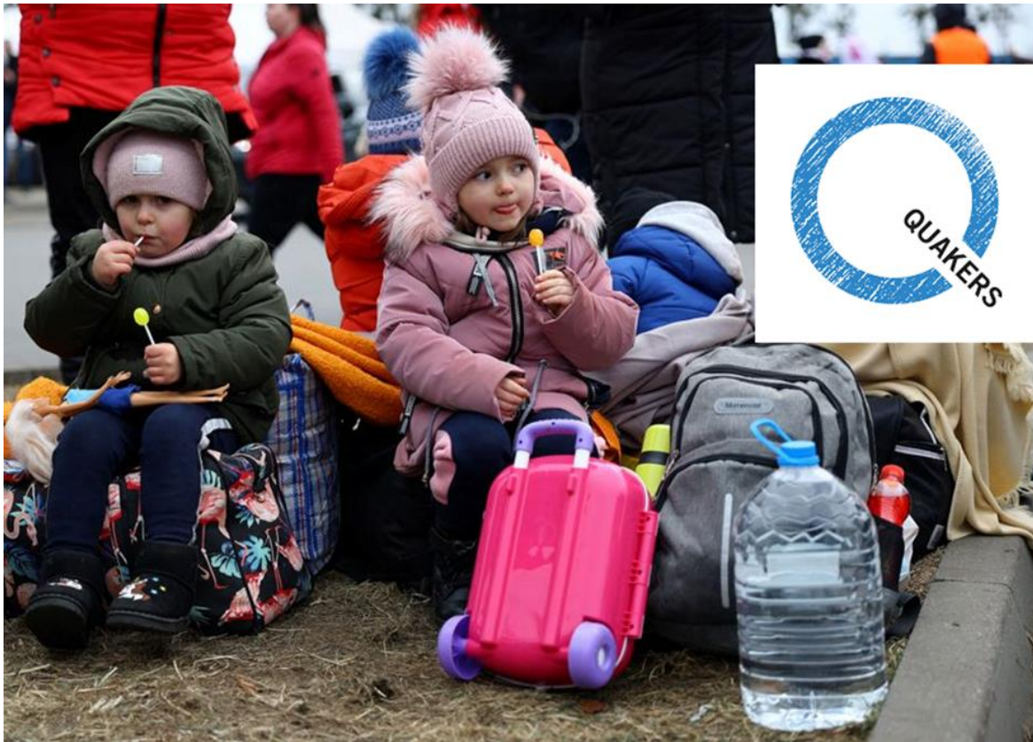
Ukrainian Refugee Children's Fund drivs av Bialystok Quakers, Poland.

De svenska kväkarnas biståndsorganisation heter Kväkarhjälp. Vill man stödja kväkarnas arbete för flyktingar från kriget i Ukraina kan man skicka pengar till den. Öronmärk pengarna: "Ukraina".