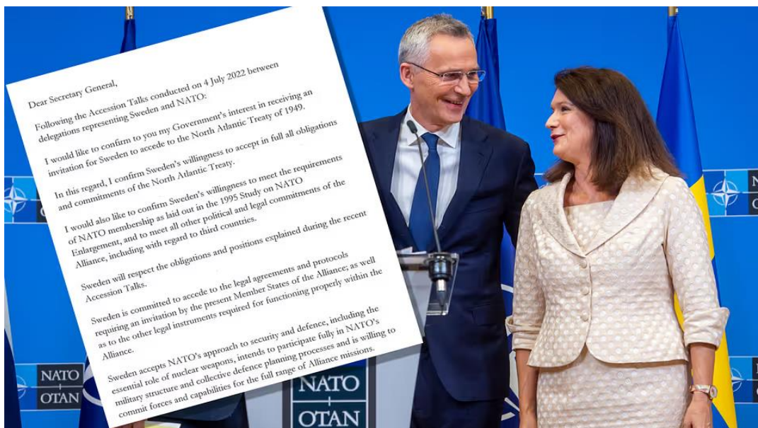
Natos generalsekreterare Jens Stoltenberg tillsammans med Sveriges utrikesminister Ann Linde med en bild av avsiktsförklaringen.

Sverige deltog i TPNW:s första statspartsmöte i juni 2022 trots att Sverige en månad tidigare hade ansökt om medlemskap i kärnvapenalliansen Nato. Men sedan tog det stopp. Den 5 juli 2022 fick Sverige nämligen status som officiellt inbjuden medlem av Nato och i samband med detta överlämnade dåvarande utrikesminister Ann Linde ett brev, en så kallad avsiktsförklaring, till Natos generalsekreterare Jens Stoltenberg. Där stod det att "Sverige accepterar Natos inställning till försvar och säkerhet, inklusive kärnvapens avgörande roll, och har för avsikt att fullt ut delta i Natos militära struktur och försvarsplaneringsprocesser". Sverige tackade alltså förbehållslöst "ja" till kärnvapnen.