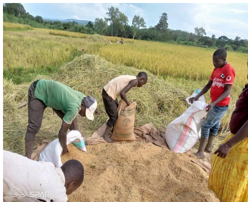
Risskörden pågår, kooperativet i Nyabitsinda

Jordbrukskooperativen inom vårt projekt "Farming & Food Security", som vi stött under många år, sprider sig till allt större områden och nya kooperativ bildas. Möjligheten till att kunna samverka och utnyttja lokala förutsättningar gör att familjer får ett bättre liv och möjlighet att betala barnens skolgång. Drömmarna om en fiskdamm för att få en ännu bättre mathållning finns kvar och förbereds. Ett nytt integrerat projekt med tillägg av information om mänskliga rättigheter och fredsklubbar förbereds tillsammans med SMR.